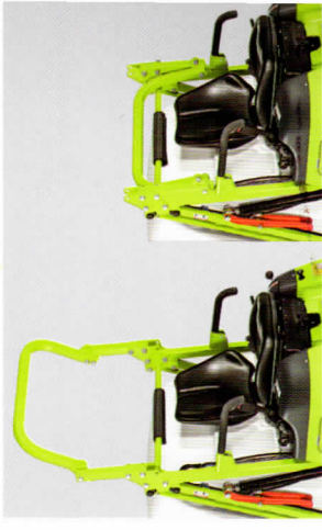
Klappbarer Überrollbügel serienmäßig