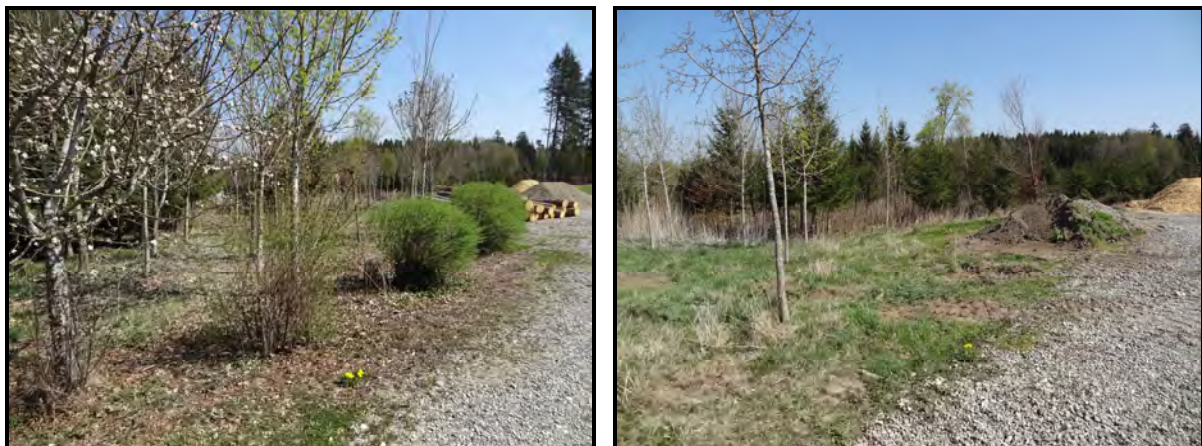
Abb. 4: Waldrandsituation mit Leitlinienfunktion für lokale Flugrouten von Fledermäusen

Der Gehölzbestand im Planungsgebiet und im unmittelbaren Umfeld des Vorhabens weist keine größeren Spalten oder Baumhöhlen auf, die als Habitat oder Quartier für Fledermäuse oder Vögel geeignet wären. Damit kann durch das Vorhaben eine Beeinträchtigung von Fortpflanzungsstätten von Fledermäusen ausgeschlossen werden. Nicht generell ausgeschlossen werden kann, dass jagende Fledermäuse tagsüber in den Rindenspalten größerer Bäume, die im Plangebiet fehlen aber z.B. im weiteren Umfeld des Planungsgebiets vorhanden sind, Ruhequartiere finden.