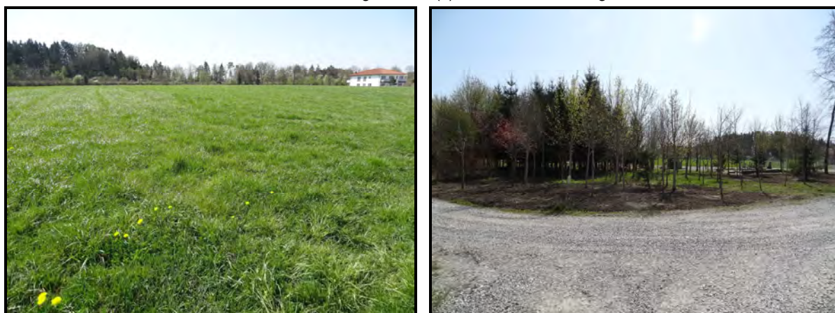
Abb. 2: Blick von Norden auf die Erweiterungsfläche (li) und die nördl. angrenzende Waldfläche

Das Planungsgebiet weist bedingt durch die Lage am Siedlungsrand, die intensive Nutzung und das Fehlen geeigneter Strukturen ein geringes Habitatpotenzial für nach § 44 BNatSchG geschützte Arten auf.